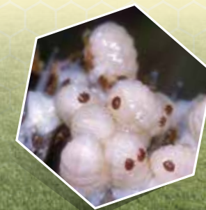
Varroa sur couvain d'abeille

En agriculture, ainsi que dans les jardins privés et publics, on utilise des produits phytosanitaires toxiques pour les abeilles. Beaucoup de ces produits tuent immédiatement les abeilles, d'autres agissent à plus long terme et d'autres nuisent à leur mobilité. Par exemple, elles ne retrouvent plus le chemin de leur ruche et ainsi meurent.